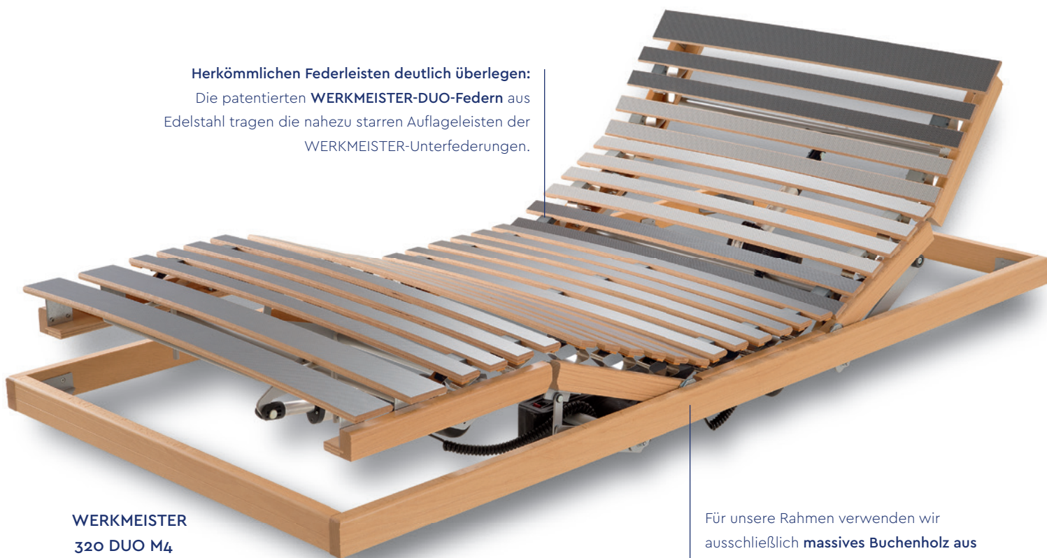
WERKMEISTER 320 DUO M4

Die patentierten WERKMEISTER-DUO-Federn aus Edelstahl tragen die nahezu starren Auflageleisten der WERKMEISTER-Unterfederungen.